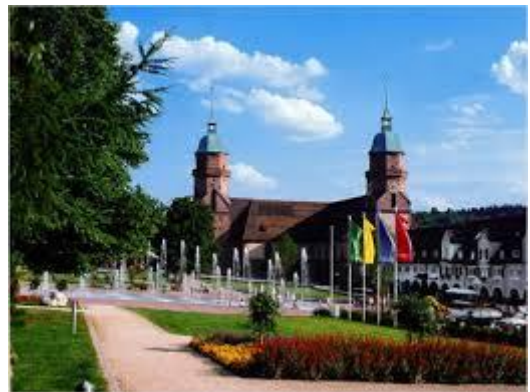
Freudenstädter Bähnle und Marktplatz

Im Anschluss an die gemütliche Stadtbesichtigung laden wir Sie ein zu einem typischen Schwarzwälder Mittagessen, wobei natürlich die Schwarzwäldertorte nicht fehlen darf. Entdecken Sie mit uns die Schönheiten des sagenumwobenen Mummelsees, an dessen Ufer das Bergrestaurant Mummelsee und die Familie Müller auf uns wartet, um uns kulinarisch und visuell zu verwöhnen. Genuss pur!