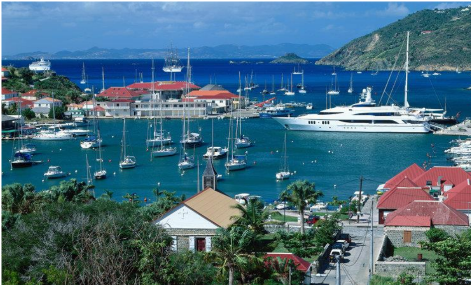
St. Barthelemy! Jetset der Reichen & Schönen

Nach dem Crew-Wechsel verlassen wir Saint-Martin in südlicher Richtung. Mit einem Zwischenstopp erreichen wir die Noblesse-Insel St. Barthelemy. Hier treffen sich die Reichen und die Schönen, Megayachten stellen sich zur Schau und ein Bummel durch den kleinen Hafen ist fast Pflicht.