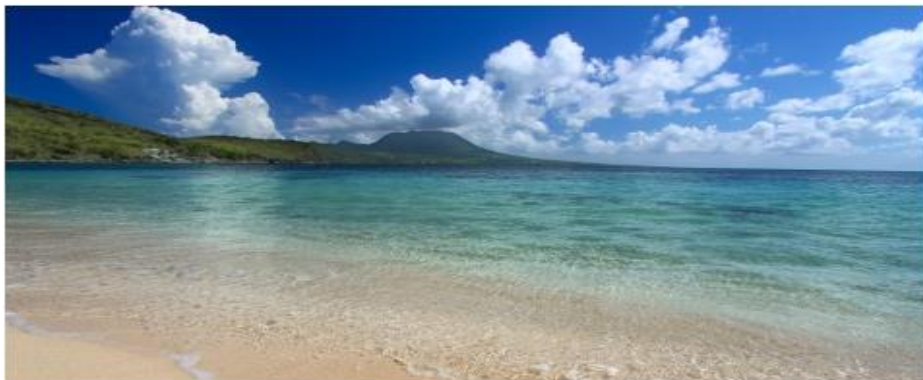
Strand von Nevis

Weiter geht unsere Reise zu der Niederländischen Inseln St. Eustatius und St. Christopher ( St. Kitts ). Hier treffen wir auf noch authentische Karibik und es besteht die Möglichkeit zur Besichtigung einer Rumfabrik, verbunden mit einem Karibischen Essen. Die kleine Insel Nevis ist unser nächstes Ziel. Bestimmt haben Sie noch nie so feinen Lobster gegessen, und erst noch in einmaliger Ambiente, direkt am Sandstrand!