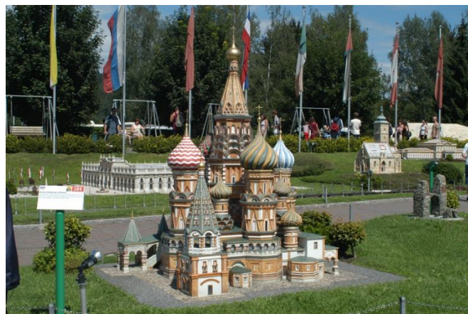
Ob Markusdom von Venedig oder Basilius Kathedrale in Moskau – Sie werden staunen...

Anschliessend Fahrt entlang dem Wörthersee zum – wie könnte es anders sein - Schloss am Wörthersee in Velden. Hier werden wir erwartet im Schlosshotel, bekannt durch seine Filme mit Roy Black und vielen anderen bekannten Schauspielern aus dieser Zeit, zu Kaffee & Kuchen.