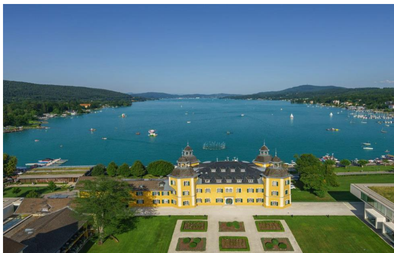
Das Schloss am Wörthersee

Anschliessend Fahrt entlang dem Wörthersee zum – wie könnte es anders sein - Schloss am Wörthersee in Velden. Hier werden wir erwartet im Schlosshotel, bekannt durch seine Filme mit Roy Black und vielen anderen bekannten Schauspielern aus dieser Zeit, zu Kaffee & Kuchen.